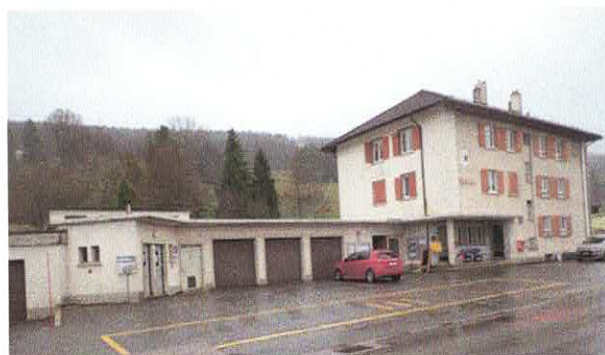
Place devant les 3 garages de Germinal Rue Centrale 12