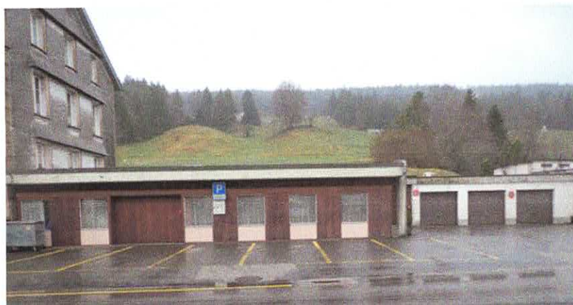
Devant la grande salle et les 3 garages Rue Centrale 14