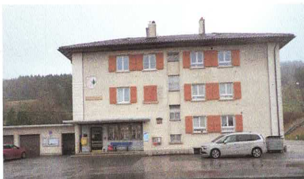
Place devant le bâtiment et l'Epicierie de Germinal Rue Centrale 12

Objet : Réfection de la place devant le bâtiment Germinal Rue Centrale 12 et la grande salle Rue Centrale 14